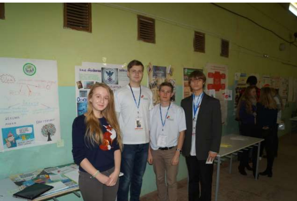
Фото с мероприятия «СОдействие» 2016 года

Упомянуть стоит и Литературный вечер «Между строк», который проводится в Мининском университете дважды в год, благодаря тому, что в 2017-ом году получил на «СОдействии» грант на реализацию.